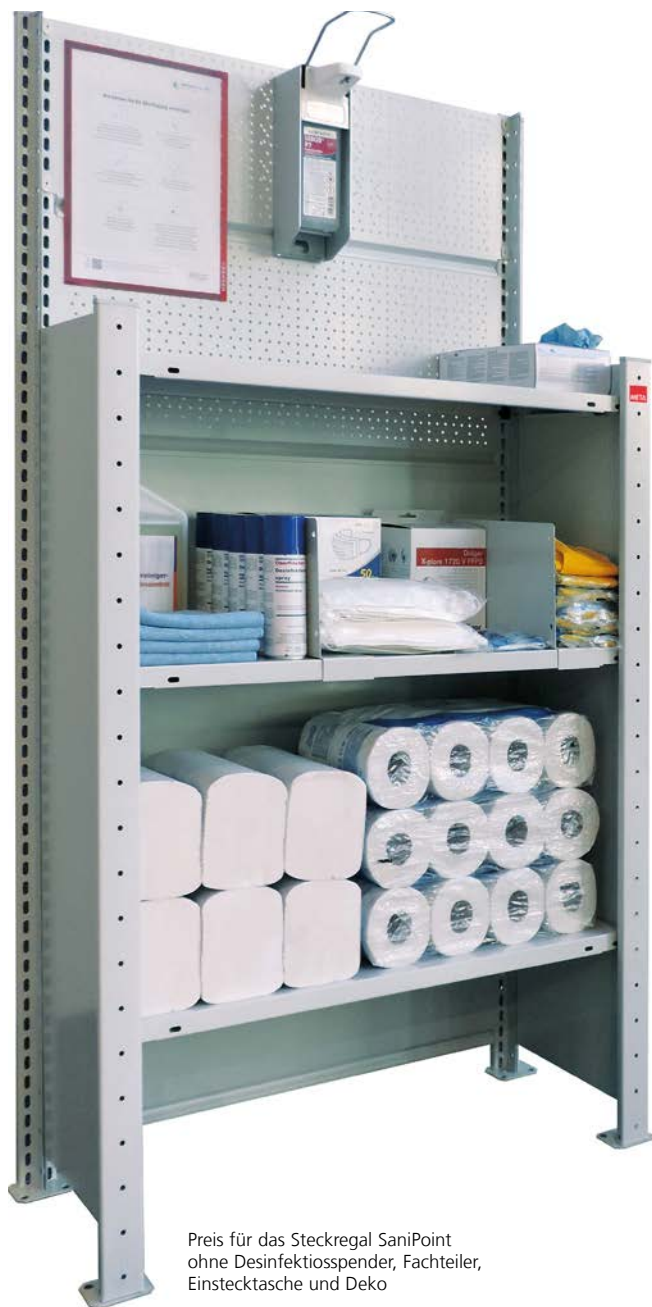
Preis für das Steckregal SaniPoint ohne Desinfektionsspender, Fachteiler, Einstecktasche und Deko